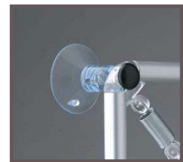
Les fixations en vitrine

Crochet de suspension pour présentation aérienne permettant l'exposition recto-verso.