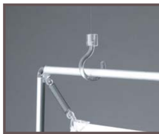
Les fixation aériennes

Pieds stables pour une présentation sur comptoir ou sur table.